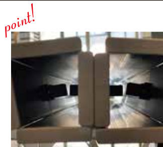
point! 大天板は四角が並ぶように内側に向かって折りたたんでください。