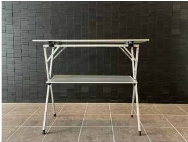
○イージーハイテーブル

この度はオンウェー製品をお買い上げいただき、誠に有難うございます。この製品はアルミ製折り畳み2段テーブルです。安全にご使用いただくためにも必ずこの取扱説明書をよく読んでからご使用ください。また、読み終わった後も大切に保管してください。製品には万全を期しておりますが、ご使用する前に必ず一度状態を確認してください。説明内容で理解できない点、及び製品に不具合が起きた際には、直ちにご購入いただいた販売店もしくは弊社お問い合わせ窓口までご連絡ください。