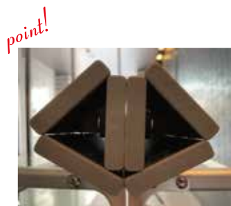
point! 小天板は三角形が二つ並ぶように内側に畳んでください。