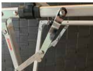
⑤ロックを下方向に外します。