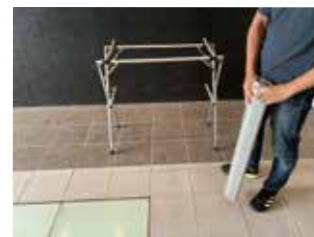
②小天板を外して畳む