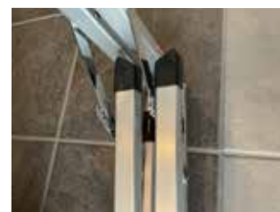
ロックの金具にぶつかからないように置みます。