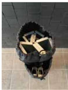
⑦収納は大天板、フレーム、小天板の順番で収納すると傷が付きにくいです。