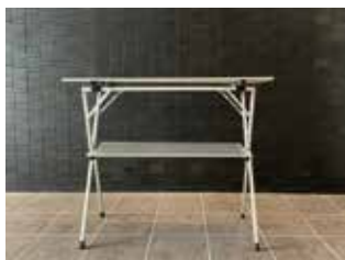
組み立て済み状態