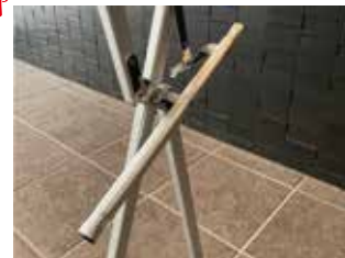
point! サイドバーは完全に閉じず、斜めにしておきましょう。