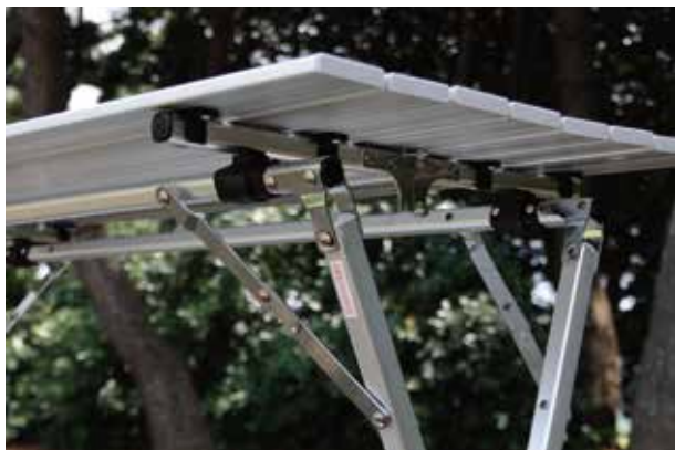
○ロック箇所はしっかりとロックしてください。