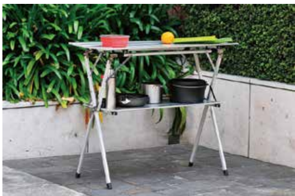
○屋外使用イメージ