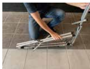
⑥足を内側に折りたたみます。