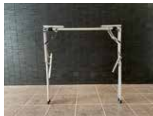
③下段のサイドバーを折りたたみます。