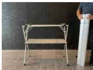
①上天板を外します。