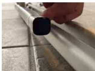
斜めになっているサイドバーを指で押して干渉しない様にしてください。