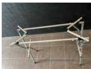
④上部サポートバーを内側に折り畳みます。