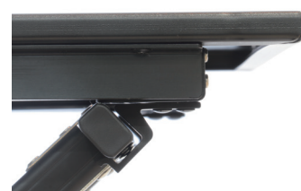
③脚部フレームに天板のフックがしっかりと引っかかるようにしてください。