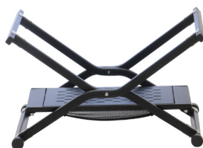
①脚部フレームを軽く開きます。