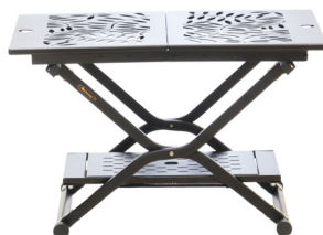
②脚部フレームに天板を乗せます。